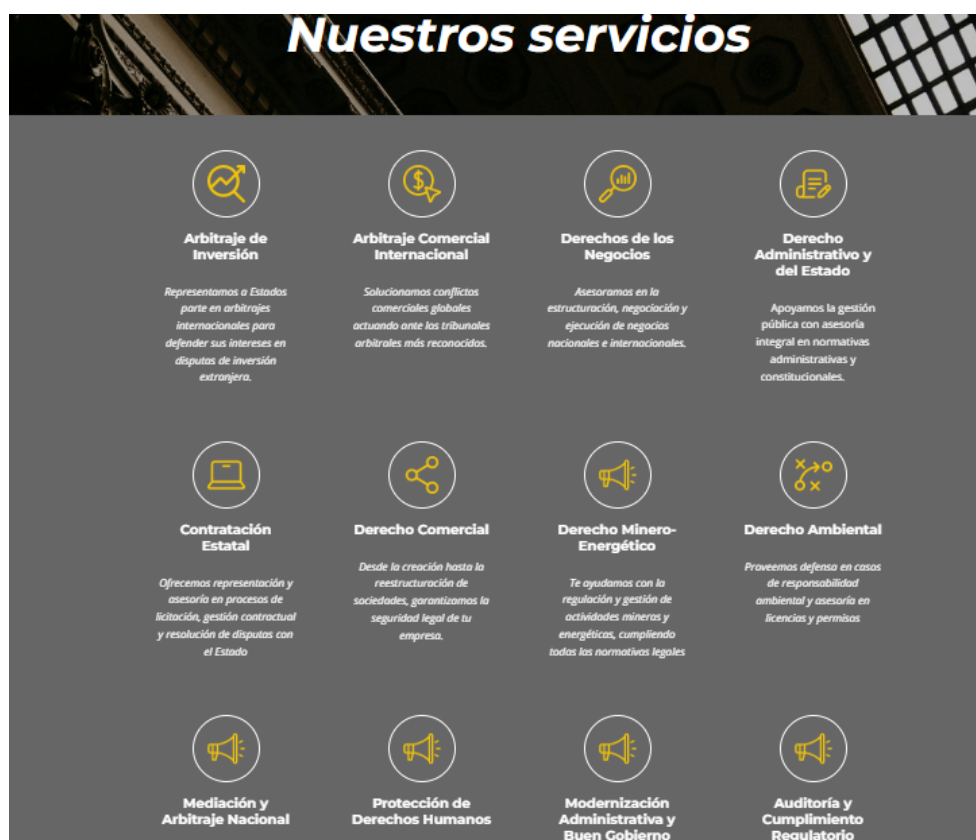
Servicios ofrecidos en la página web de Astrea Abogados Asociados SAS

Los abogados que aparecen como parte de Astrea Abogados Asociados SAS no tienen ninguna experiencia relacionada con casos de arbitramento internacional, litigios internacionales, derecho minero, conflicto armado, defensa del Estado, es decir, no tienen ninguna experiencia probada en los asuntos propios del litigio en el que sería el aliado estratégico de la firma internacional. Tampoco demuestran dominio del inglés, aspecto relevante pues la mayor parte de estos litigios se adelantan en ese idioma.