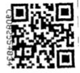
Figura notarial para uso exclusivo de copia de escritura pública, certificaciones y documentos del archivo notarial