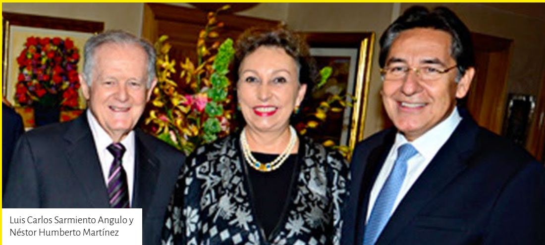
Luis Carlos Sarmiento Angulo y Néstor Humberto Martínez