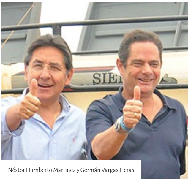
Néstor Humberto Martínez y Germán Vargas Lleras

Martínez le asesoró al Grupo Aval, la suma ascendió a 3.557 millones de dólares. De dólares, no de pesos. Y son amigas entrañables las dos familias, apenas obvio que sea así.