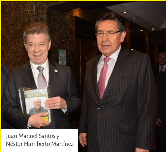
Juan Manuel Santos y Néstor Humberto Martínez

ESTE ES UN LISTADO DE NOMBRES DE EMPRESAS UTILIZADO POR NÉSTOR HUMBERTO MARTÍNEZ PARA SUS CONTRATACIONES.