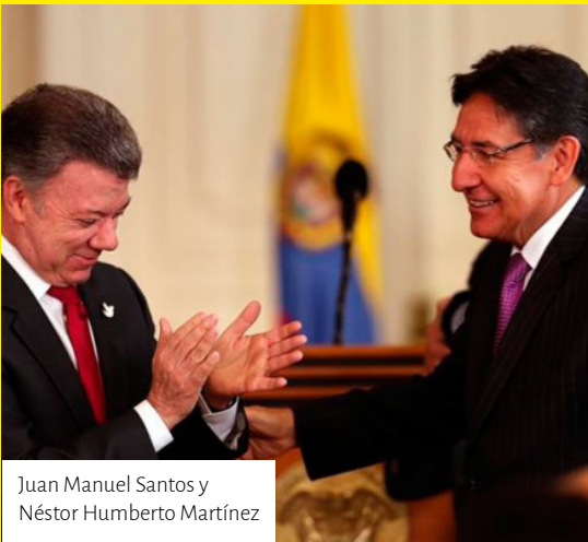
Juan Manuel Santos y Néstor Humberto Martínez